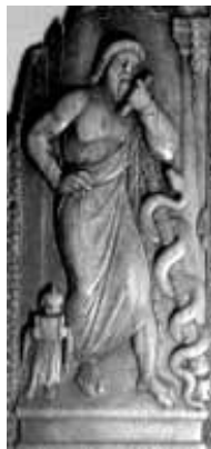
Äskulap / Asklepios

„Die Anatomie zeigt uns wohl das Aeußere aller der Theile, die das Messer oder die Säge oder die Maceration trennen kann, aber in das Innere verstattet sie uns nicht zu sehen; auch wenn wir die Eingeweide aufschneiden, so sehen wir blos das Aeußere dieser innern Fläche. Selbst, wenn wir Thiere oder wie Herophilus, grausamen Andenkens, Menschen noch lebend öffnen, können wir so wenig in die innern Verrichtungen der vor Augen liegenden Theile einen tiefen Blick thun, daß selbst der Wißbegierigste und Aufmerksamste unbefriedigt davon geht; auch mit den besten Vergrößerungsgläsern kommt er nicht weiter, wenn ihm die Strahlenbrechung nicht optische Betrüge spielt. Er sieht blos das Aeußere der Organe, er sieht blos die gröbere Substanz; ins innere Wesen aber und in den Zusammenhang des Vorgangs dringt sein irdisches Auge nie.“