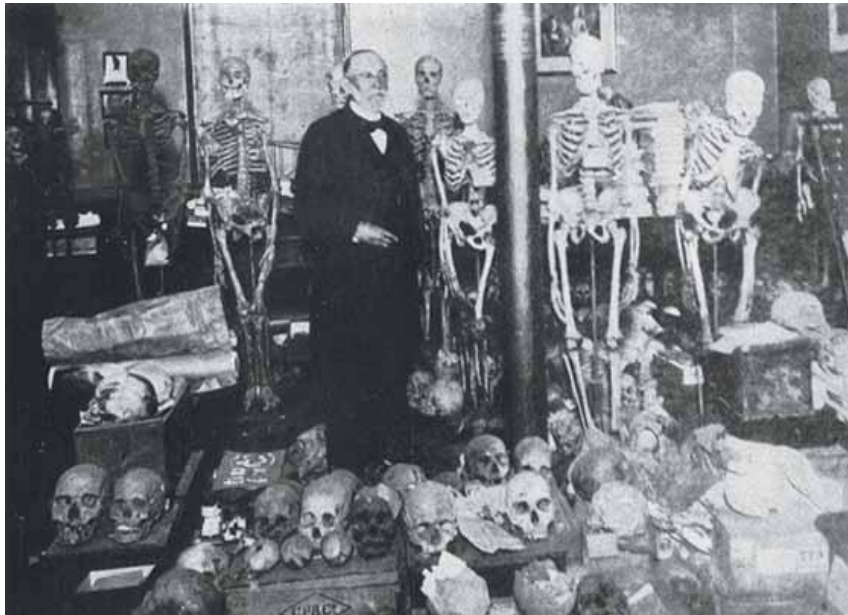
Rudolf Virchow in seinem Arbeitszimmer in der Charité

Der eigentlich vielversprechende Ansatz, den Menschen ins Zentrum der Welterkenntnis zu stellen, blieb rasch zurück hinter den Eigendynamiken der angewandten Erkenntnis-Werkzeuge, hinter einer sich verselbständigenden Dynamik einer Erkenntnis-Methodik, welcher Leben und Geist im Wesen fremd bleiben mussten und bis heute fremd sind. Der Mensch wurde dabei zum relativ beliebigen Objekt der Wissenschaften wie alles andere auch, während das Grundmenschlichste unserer Existenz vor der Tür blieb.