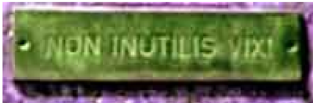
„ich lebte nicht vergeblich“ Hahnemanns selbst gewählte Grabinschrift

Damit ist auch schon eine Grenze bezeichnet und eine Gratwanderung, auf der wir uns befinden, denn die Zeit der Denkmäler ist vorbei. Auch mit diesem Vortrag und seinem Thema befinde ich mich auf genau dieser Gratwanderung. Mehr als hundert Jahre trennen uns schon vom „Jahrhundert der Denkmäler“, und doch müssen wir uns hüten vor den unsichtbaren Denkmälern. Es kann nicht darum gehen, jemanden auf den Sockel zu heben, nicht die Persönlichkeit ist wichtig (oder gar deren Verewigung zu eigenen Zwecken), sondern allein der Geist, welcher diese nachstrebte. Wenn wir uns dazu entschieden haben, können wir versuchen, demselben Geiste nachzustreben. Wir können uns darüber hinaus bemühen, Hahnemanns Arbeitsprinzipien zu verstehen, und dazu ist wiederum das Verständnis des historischen Kontext sehr nützlich. Ich wünsche dem Torgauer Haus, dass es in diesem Sinne ein guter Ort der Erinnerung wird. Auf solche Weise und nicht anders möchte ich mich heute mit Hahnemann beschäftigen, mit seinen Schriften vor und ab dem Erscheinen des Organon .